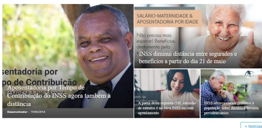
Figura 5 - Módulo de notícias mais recentes

O módulo de notícias é onde ficam disponibilizadas as notícias mais recentes postadas no site. As notícias postadas se referem a atos da gestão do ente ou divulgação de prestação de algum serviço.