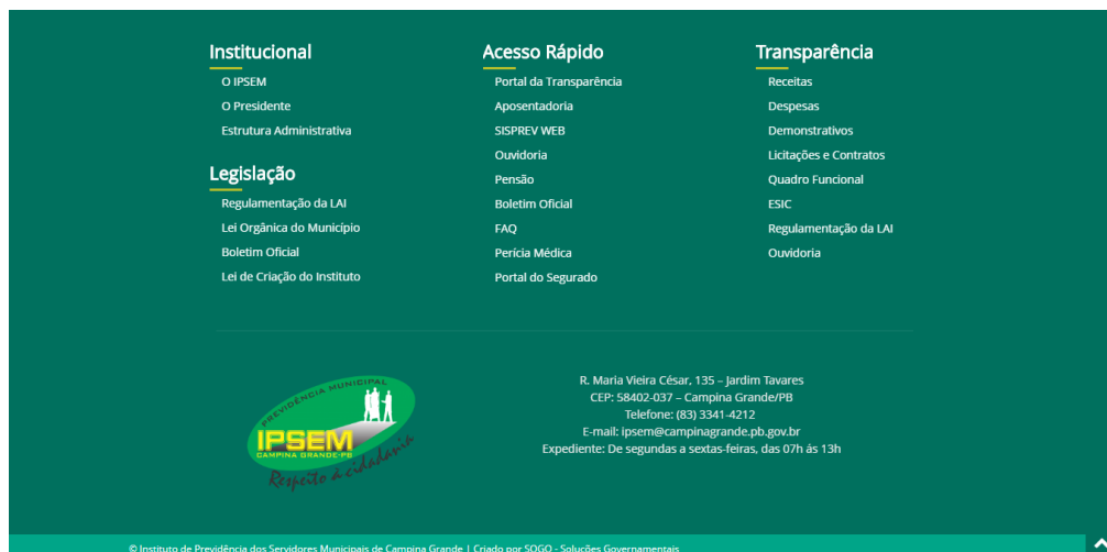
Figura 7 - Rodapé

No rodapé é disponibilizado o mapa do site , com todos os menus, acessos e seus respectivos links. Além disso, no rodapé também é disponibilizado a logomarca do ente, informações de localização e contato.