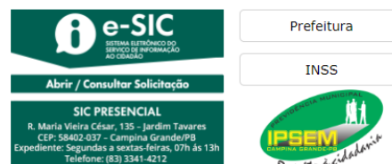
Figura 6 - Acesso rápido