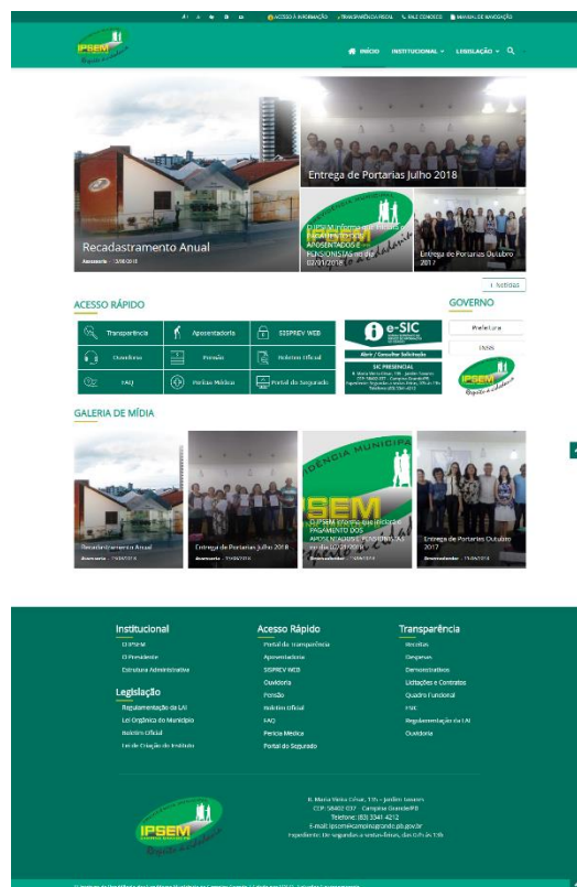
Figura 1 - Página inicial completa